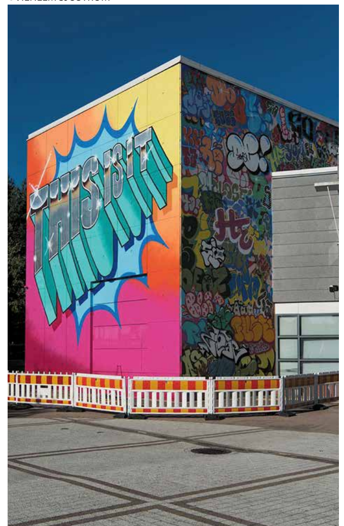
This is it! -graffiti (2016) Myyrmäessä. Näkymä Paalutorilta.