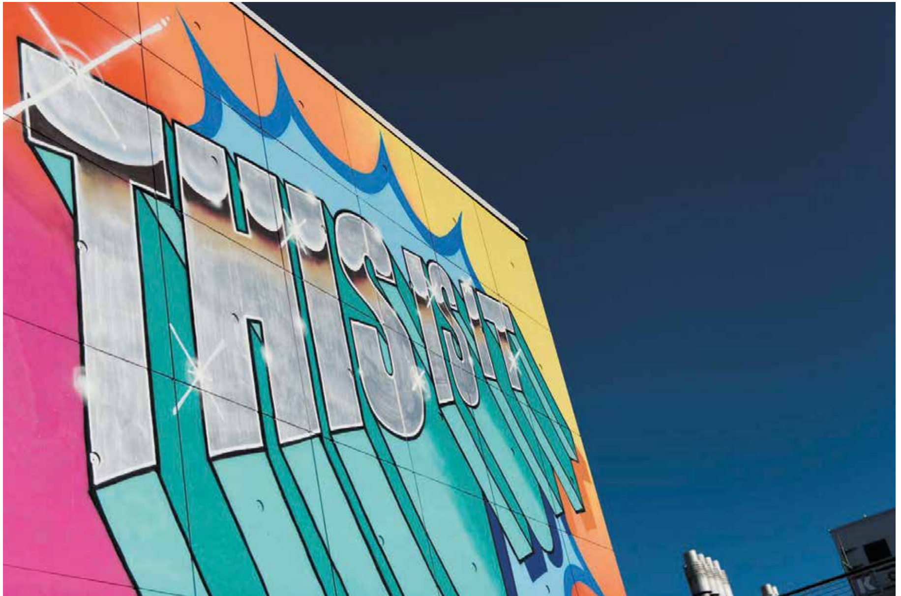
Suomen massiivisin pysyvä graffitti, 350-neliöinen This is it! syntyi Vantaan Myyrmäkeen vuonna 2016. Se on kahdeksasta maalarista koostuneen Hende ja Deos Ensemblen kunnianosoitus graffitin historialle ja nykyisyydelle. Kuvassa oleva näkymä avautuu Paalutorille päin.